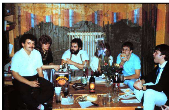
Jobbról a második a zalai kormány megbízott