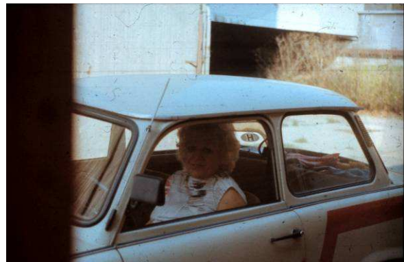
Cila mama és legendás Trabantja