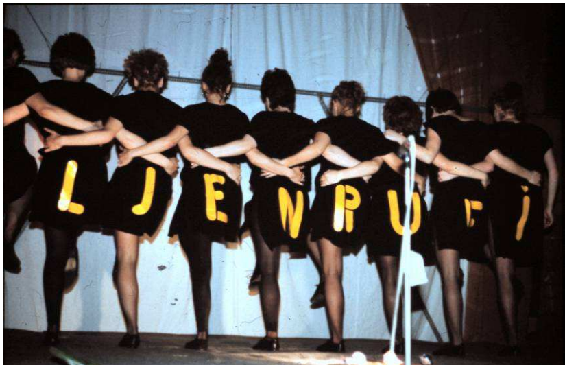
Az első Bolyais, akinek nevét lányok formás popója hirdette ☺