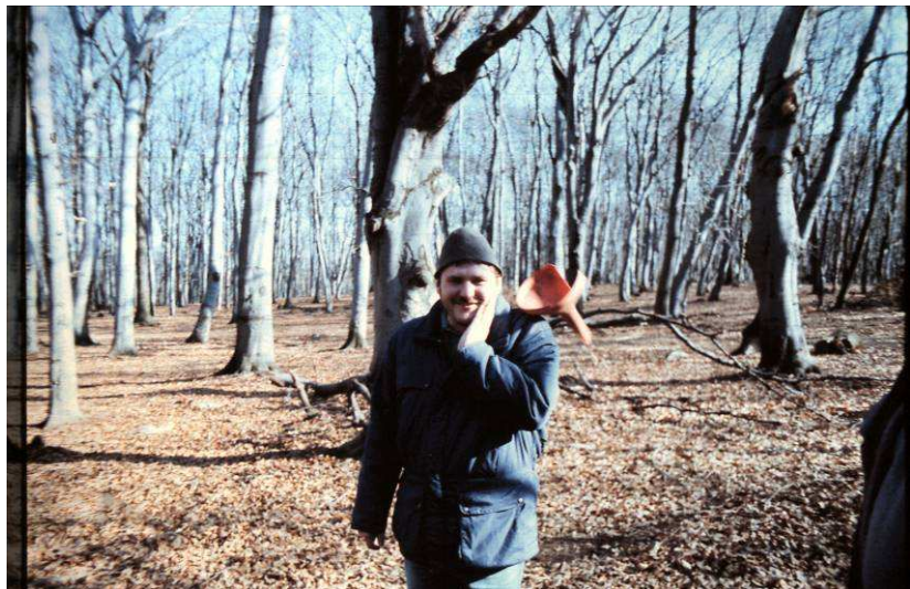
Az ember, akinek tölcsér nőtt a vállára ☺ avagy UFO-észlelés Várgesztesen ?