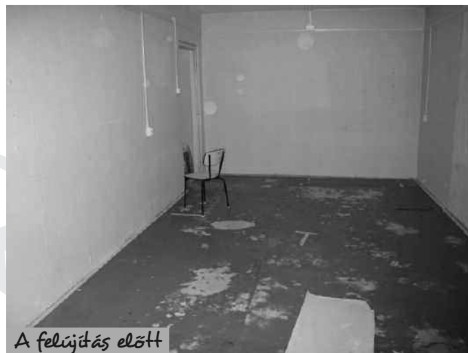
A felújítás előtt

Hálánkat kifejezve, hogy gólyaként befogadtak minket eme nagyszerű közösségbe, viszonzásul hősiesen toboroztuk az új embereket főzőtudományunkkal (csak hogy néhányat említsünk: sós cukorborsó főzelék, gulyáslevesnek indult paprikás krumpoli és a többiek), melynek folyamatát nevesítettük, a MV Donald's névre hallgat.